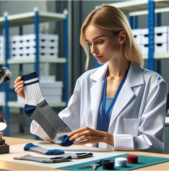
Contrôle qualité 1 demie journée *