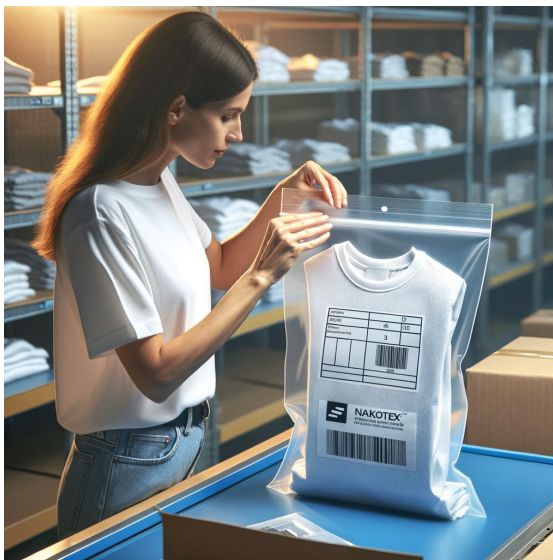
Emballage / Finition 1 demie journée *