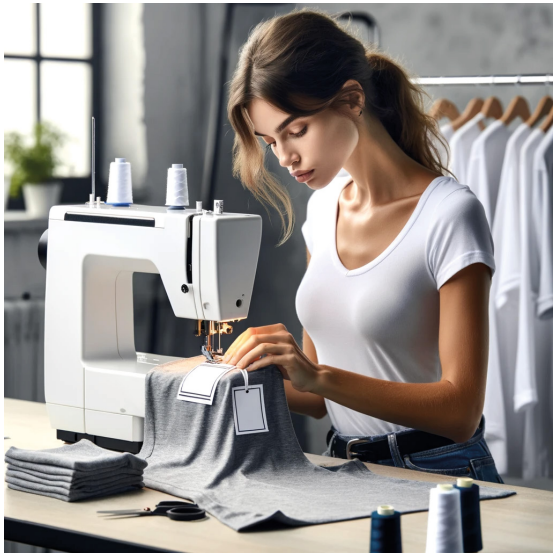
Pose des étiquettes / finition 1 demie journée *