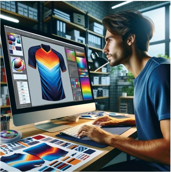
Design et développement 1 à 2 semaines *