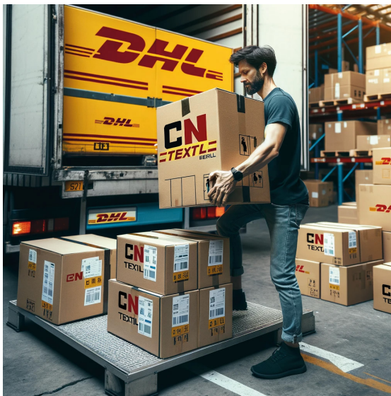
Expédition (Worldwide) 1 à 2 semaines*