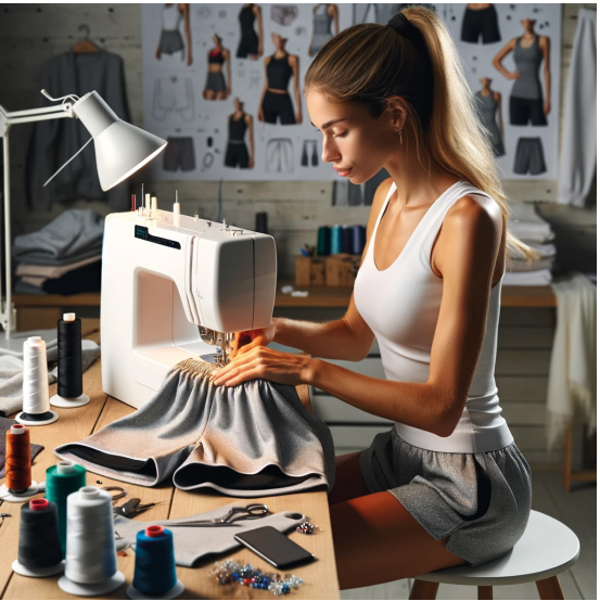
Production / Assemblage 1 semaine *